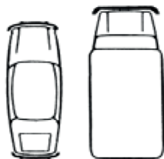
Grafico dell'incidente al momento dell'urto

Indicare i danni visibili al veicolo Leasys